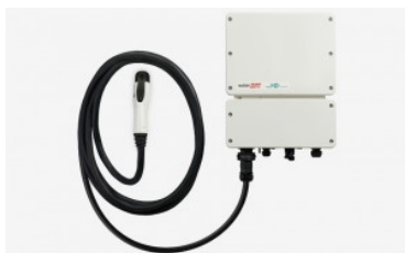
SolarEdge HD Wave VE

El inversor de conexión a red SolarEdge CC-CA está especialmente diseñado para trabajar con los optimizadores de potencia SolarEdge . Debido a que la gestión MPPT y la gestión del voltaje se realiza independientemente para cada módulo por los optimizadores, el inversor solo es responsable de la conversión de CC a CA. En consecuencia, este es un sistema menos complicado, con unos costes más efectivos, y más eficiente, con una garantía estándar de 12 años, extensible a 20 ó 25 años. El voltaje fijo de operación por string asegura un funcionamiento con la mejor eficiencia bajo todo tipo de condiciones, independientemente de la longitud del string y la temperatura.