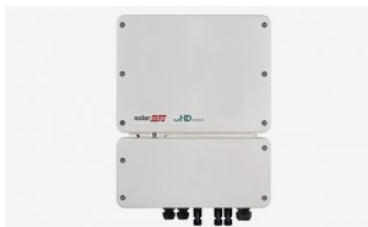
SolarEdge SE HD Wave