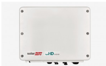
SolarEdge SE HD Wave

La tecnología de los inversores SolarEdge HD-Wave, ganadora del prestigioso galardón Intersolar award 2016, rompe los moldes de los inversores tradicionales